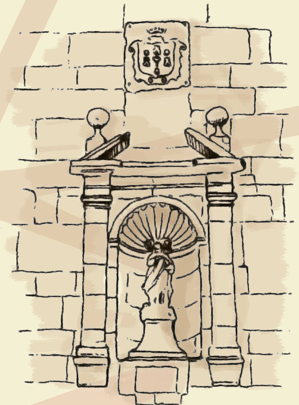
Debajo de la hornacina hay una inscripción, –A(ÑO 1)728–, que señala la fecha en que se colocó ese elemento.

Este edificio, construido en la primera mitad del siglo XVII, destaca especialmente por su fachada. A partir de un evidente eje vertical situado en su centro del que forman parte la entrada, la hornacina, el escudo y el añadido para el reloj se estructura una composición simétrica que resulta remarcada por las pequeñas molduras que recorren la fachada. En su planta baja, respetando la misma composición, se abre un amplio pórtico de cuatro arcos de medio punto.