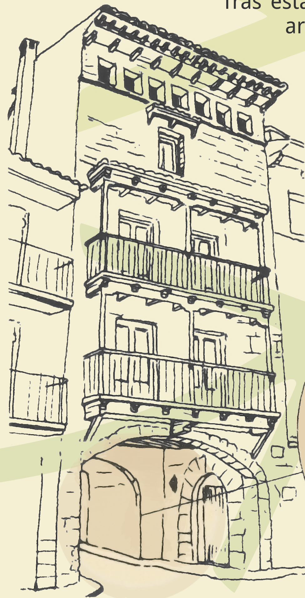
Aspecto exterior del Primer Portal de Rubielos

Tras esta modificación, el primitivo arco de entrada quedó oculto en su interior y la nueva fachada del portal pasó a descansar sobre el arco rebajado que todavía se conserva.