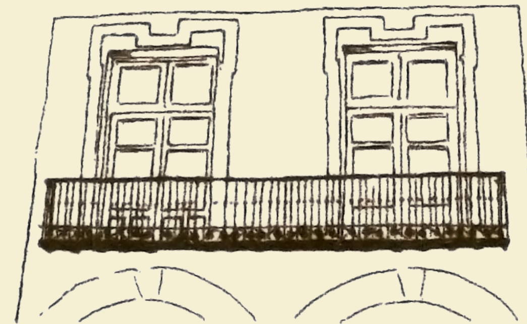
Balcón y molduras