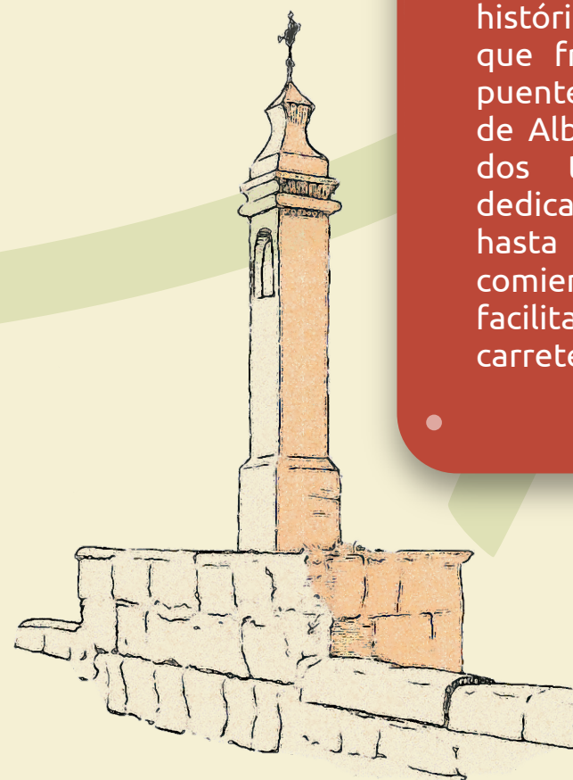
Tajamar y Pílon del Milagro

Éste era uno de los accesos históricos a la villa, de modo que frente a la entrada del puente se encontraba el portal de Albentosa, flanqueado por dos torres y una capilla dedicada a la Virgen del Pilar, hasta que fue derribado a comienzos del siglo XX para facilitar el trazado de la carretera de Rubielos de Mora.